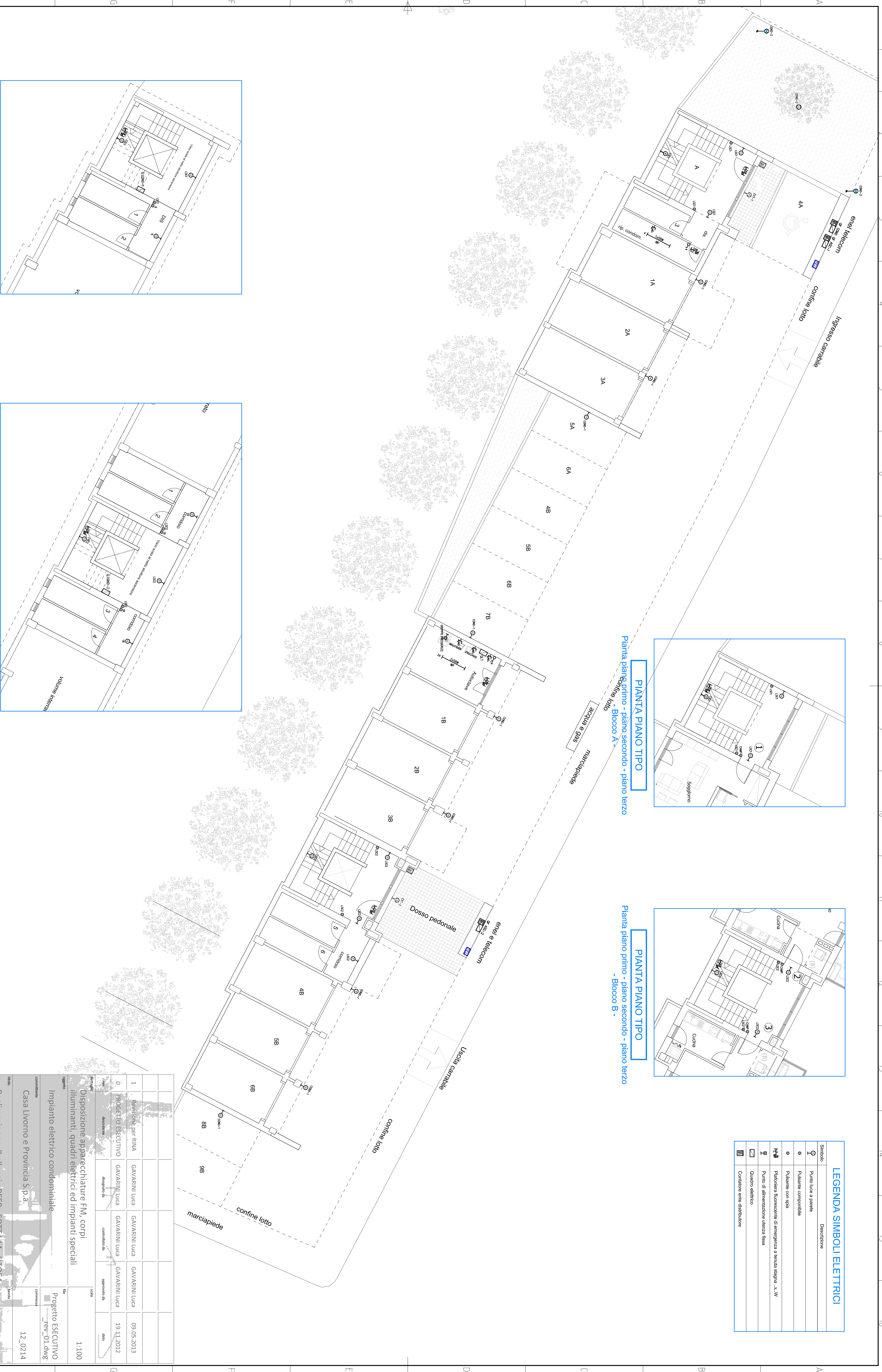
PIANTA PIANO INTERRATO